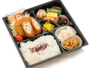
■会席弁当(肉メイン) ¥900~