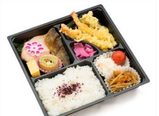
■会席弁当(魚メイン) ¥1,000~