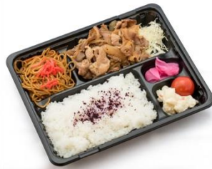
■しょうが焼き弁当 ¥700~